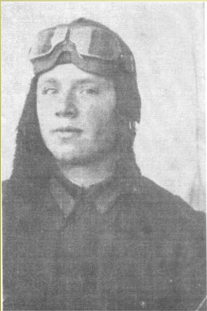
1942год. Курсант Новосибирской школы военных лётчиков.