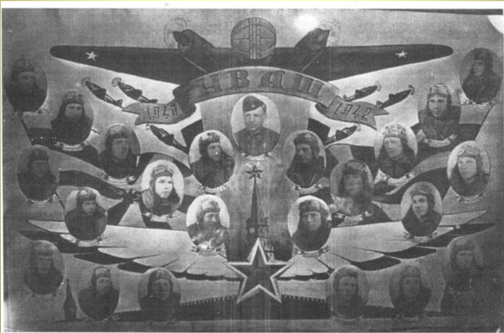
1942 год. Курсанты Новосибирской школы военных лётчиков. На фотографии скоростной бомбардир, который выпускался на Казанском производственном объединении им. С.П.Горбунова (КАПО) в г. Казани.