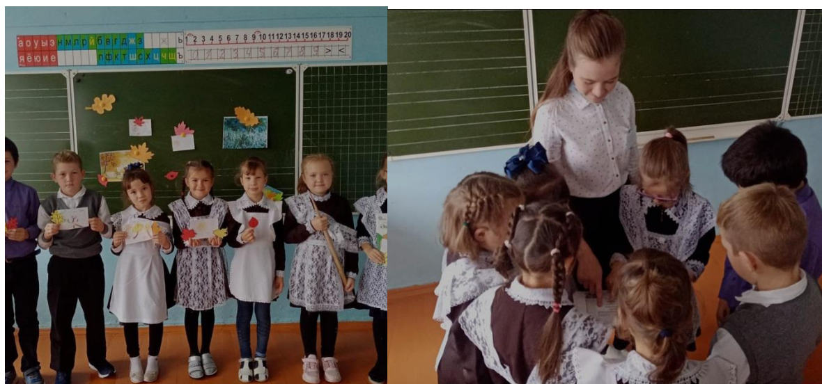
Члены отряда активные помощники в организации различных мероприятий

Отряд профилактики школы проявляет заинтересованность в судьбе каждого ученика, организует свободное время, вовлекает их в активную деятельность и привлекает к дополнительному образованию. Работа отряда строится на основе систематической разъяснительной работы среди обучающихся школы