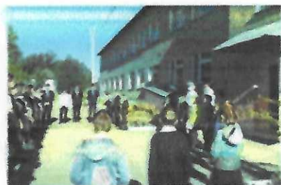
День солидарности в борьбе с терроризмом 03.09.2020