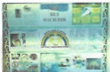
"Мир без насилия" 19.10.2020