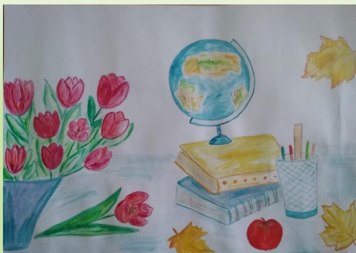
Махиянов Марсель, 5 нче Б сыйныфы укучысы