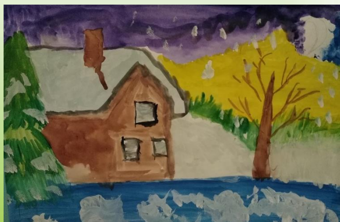
Шангараев Эмиль, 3 нче Б сыйныфы укучысы