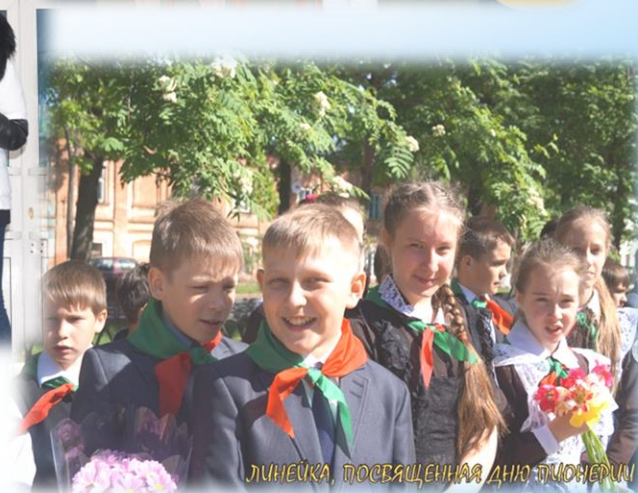
Линейка, посвященная дню пионеров