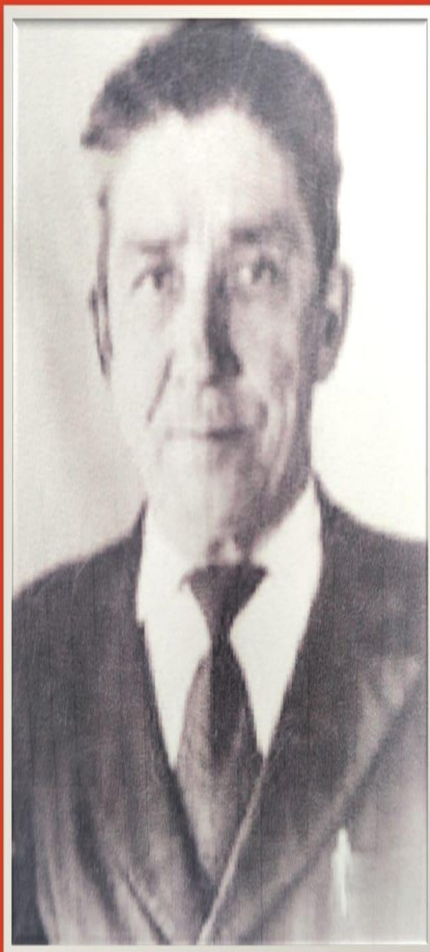
БИККЕНИН ШАКИР ХУСНУТДИНОВИЧ (1910–1986)