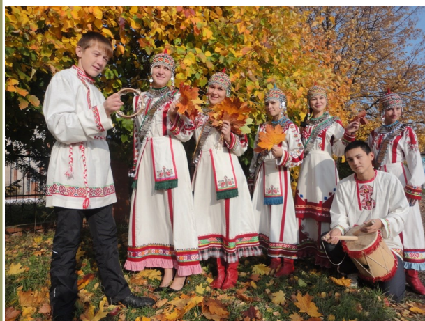
Материал подготовила Г.Хмельникова, студентка 301 группы

Студенческий чувашский ансамбль «Мерчен» Тетюшского педагогического колледжа стал Лауреатом III степени Открытого Всероссийского фестиваля - конкурса традиционной художественной культуры «ЭТНОМИРАДА».