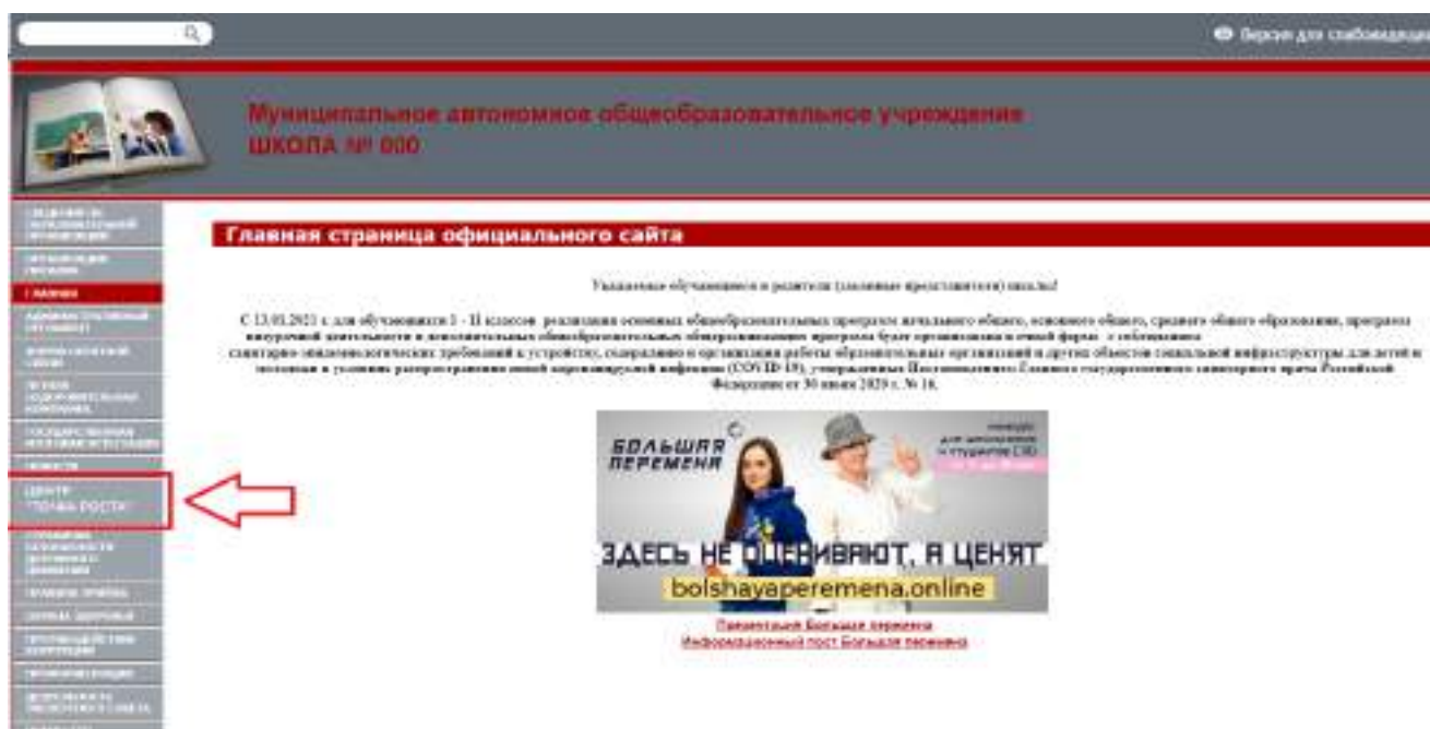
Рисунок 2. Пример размещения ссылки на раздел на сайте общеобразовательной организации

На официальном сайте общеобразовательной организации, в которой создается центр образования естественно-научной и технологической направленностей «Точка роста» (далее – центр «Точка роста», центр) в рамках федерального проекта «Современная школа» национального проекта «Образование», не позднее даты начала функционирования центра (не позднее 1 сентября года создания центра) создается раздел «Центр «Точка роста». Ссылка на раздел размещается в главном меню сайта общеобразовательной организации и должна быть видима при просмотре каждой страницы. Ссылка не может являться вложенной в другие меню. Пример размещения ссылки на раздел «Центр «Точка роста» в меню официального сайта общеобразовательной организации в информационно-телекоммуникационной сети «Интернет» приведен на рисунке 2.