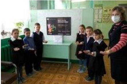
Акция «Сдай батарейку- спаси планету»