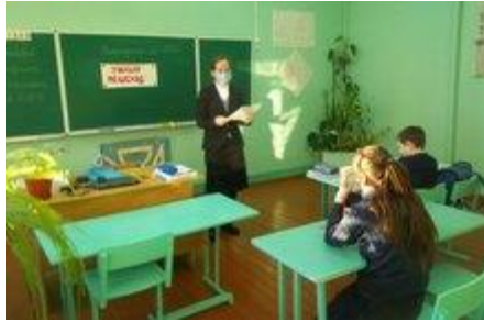
Викторина «Умный пешеход»