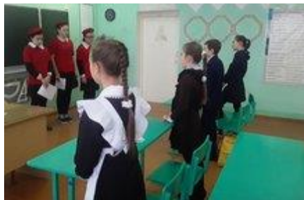
День Неизвестного Солдата