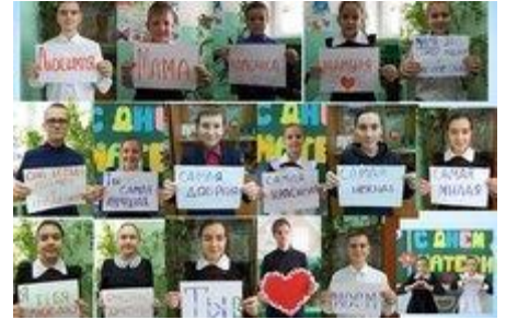
Мамочка, с праздником!