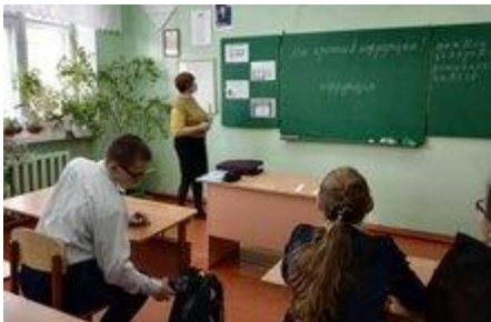
Мы против коррупции