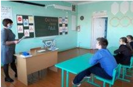
Интеллектуальная игра по ПДД