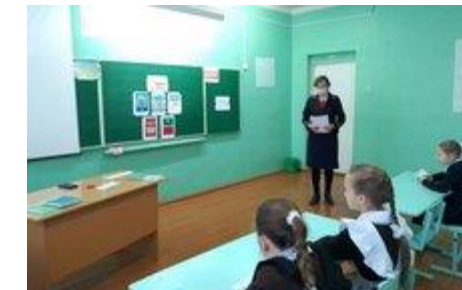
Единый урок прав человека