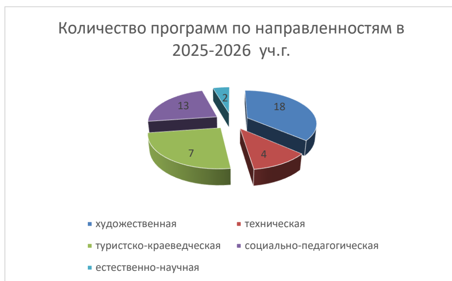
Таблица 5: Характеристика объединений по направлениям с указанием количества учащихся

В 2025-2026 учебном году образовательный процесс будет реализовываться по 44 программам дополнительного образования для детей в возрасте 5-18 лет.