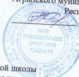
График посещения столовой школы с целью осуществления контроля качества питания обучающихся (по предварительному согласованию с администрацией)