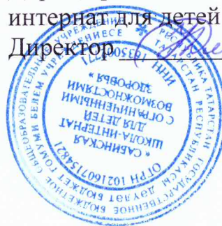
График родительского контроля организации питания обучающихся ГБОУ «Сабинская школа-интернат для детей с ограниченными возможностями здоровья» на 2024/2025 учебный год