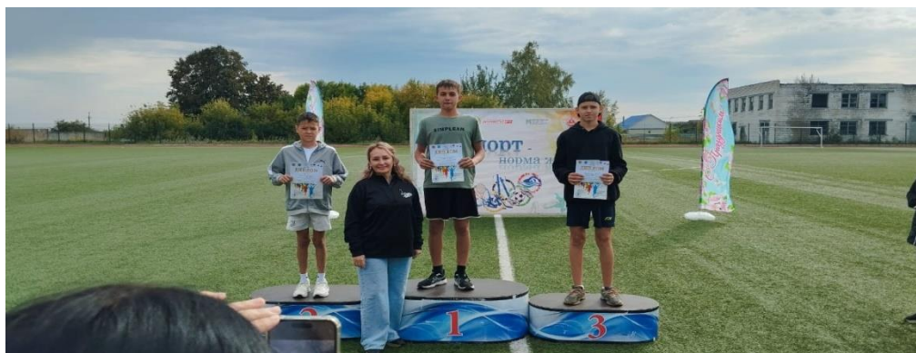
Награждение «кросс наци». Команда заняла 2 место.

Помимо спорта есть у нас талантливые ученики, которые с удовольствием участвуют в разных конкурсах, блещут своими талантами. Все наши ученики болеют и гордятся ими и хотят стать такими как они.