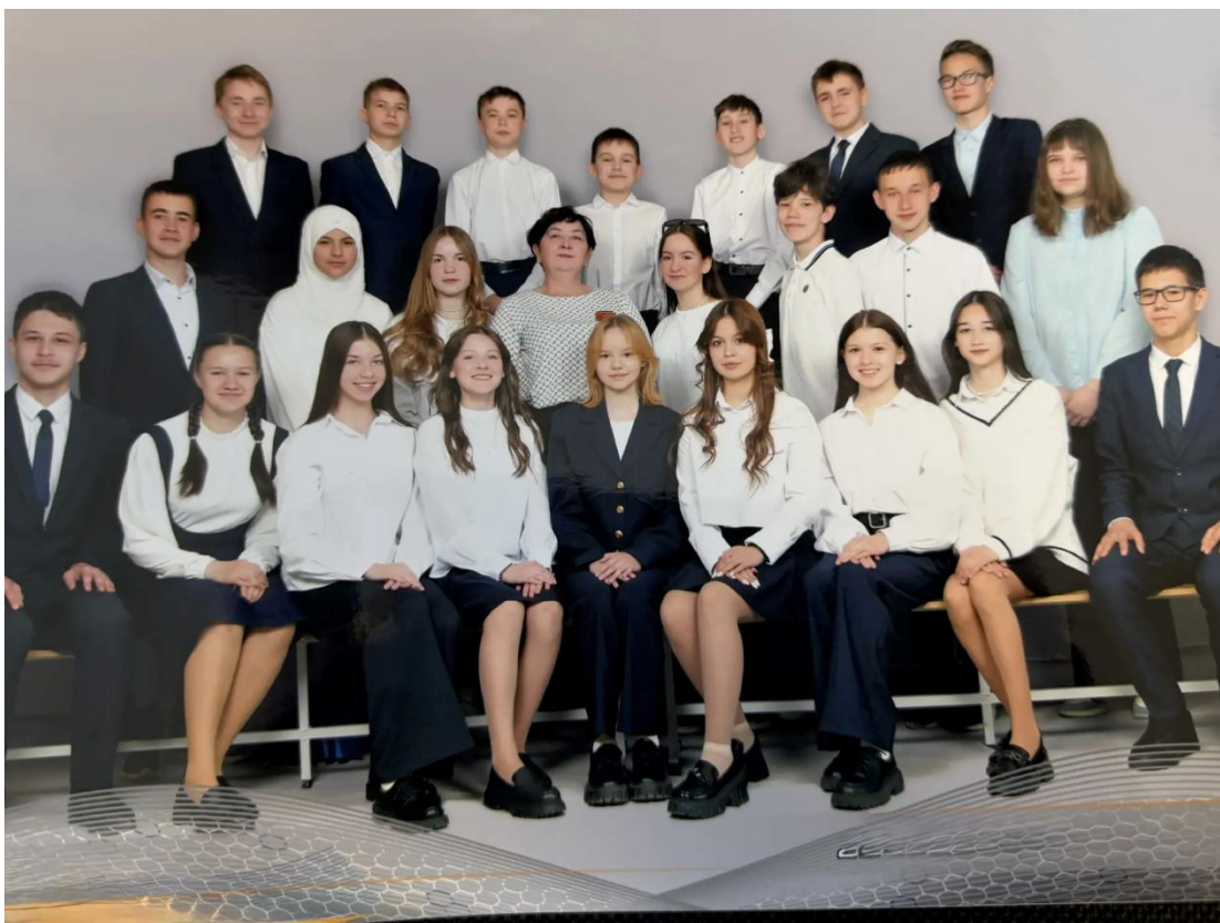
Отряд профилактики правонарушений. 01.09.2025 г.