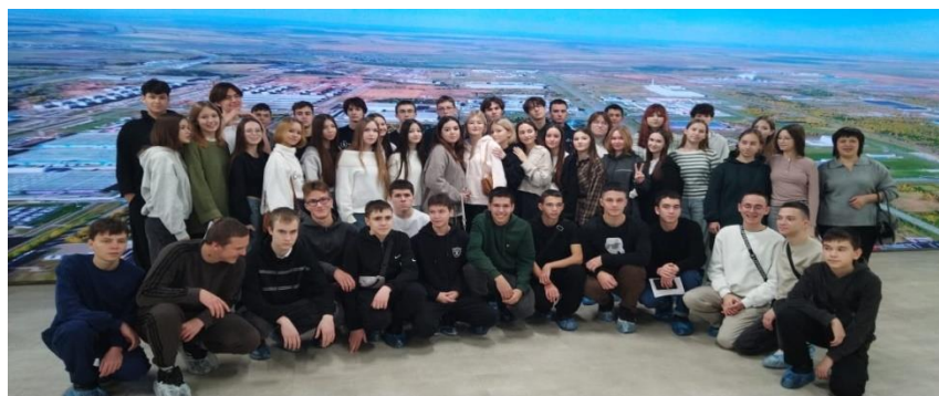
Взаимодействие с учреждениями профессионального образования.