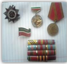
Орден, медальләр Бөек Жиңүнән 60 еллыгы