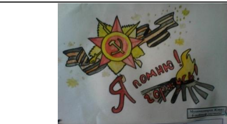
Мухамадияров Жәвид С.Ф.Әхмәтҗанович исемендәге Шәле урта гомуми белем биру мәктәбе