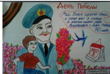
Гибашова Нурия С.Ф.Әхмәтҗанович исемендәге Шәле урта гомуми белем биру мәктәбе