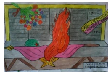
Галиуллина Лилия С.Ф.Әхмәтҗанович исемендәге Шәле урта гомуми белем биру мәктәбе

Буын арты буын алмашыр, ләкин Бөек Жиңү һәм шушы жиңүне яулап алган какшамас фронт һәм тыл каһарманнарының якты истәлегә халык күңелендә мәңге яшәр. Хөрмәт сугыш һәм тыл ветераннары! Сезне чын күңелдән Бөек Жиңүнән 70 еллыгы белән котлыйбыз. Сезгә саулык-саламәтлек, иминлек, тыныч тормыш телибез. Күпме еллар үтсә дә, безнең хәтердә Бөек Ватан сугышы иң авыр, иң дөһшәтле сугыш буларак сакланыр. Жиңү бәйрәменә багышланган бәйрәмдә сезнең чал чәчләрегездән сыйпыйсы, дөньядагы иң матур сүзләр белән юатасы, мең рәхмәт әйтсә килә! Илләребез имин, күкләребез һәрчак аяз булсын!.. Кабат сугыш афәтләрен күрергә язмасын!