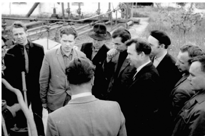
При решении производственных вопросов

что нужно работать ещё лучше, искать резервы и никогда не успокаиваться на достигнутом. Он прошёл путь от помощника мастера до главного инженера объединения «Татнефть», Он стоял у истоков «Джалильнефти», ставшего со временем самым крупным управлением компании «Татнефть». Главный инженер НПУ