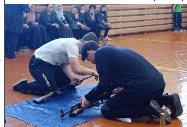
IX сыйныф кызлары

Мәктәптә укучы барча малайларны һәм эшләүче абыйларны Ватанны саклаучылар көне белән котлыйбыз! Без сезгә ышанабыз, егетләр!