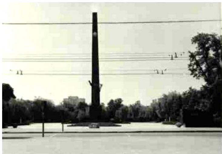
Луцк шәһәрэндәге мемориаль туганнар каберлеге

1944-нче елның язында Хәбибулла бабайга чираттагы полковник званиесы бирелә. Бу вакытта ул Көнбатыш Украинаны азат итү сугышларында катнаша. 17-нче июль көнне дошманның Волын өлкәсе Сенкевичи районындагы көчле ныгытылган оборона линияләрен өзгәндә үзе сугышчыларын атакага алып бара. Әлегә һөжүм полковник Хөснүллинның соңгы сугышы була. Снаряд кыйпылчыгынан авыр яраланып ул 29-нч август көнне госпитальдә вафат була. Үлгәннән соң Хәбибулла бабай тагын бер 1-нче дәрәжә “Ватан сугышы” ордены белән бүләкләнә. Башта аны шул Сенкевич районындагы Загайник авылы зиратына җирлиләр. Соңрак мәете Луцк шәһәре үзәк паркындагы 900 сугышчы күмелгән мемориаль туганнар каберлегенә күчерелә.