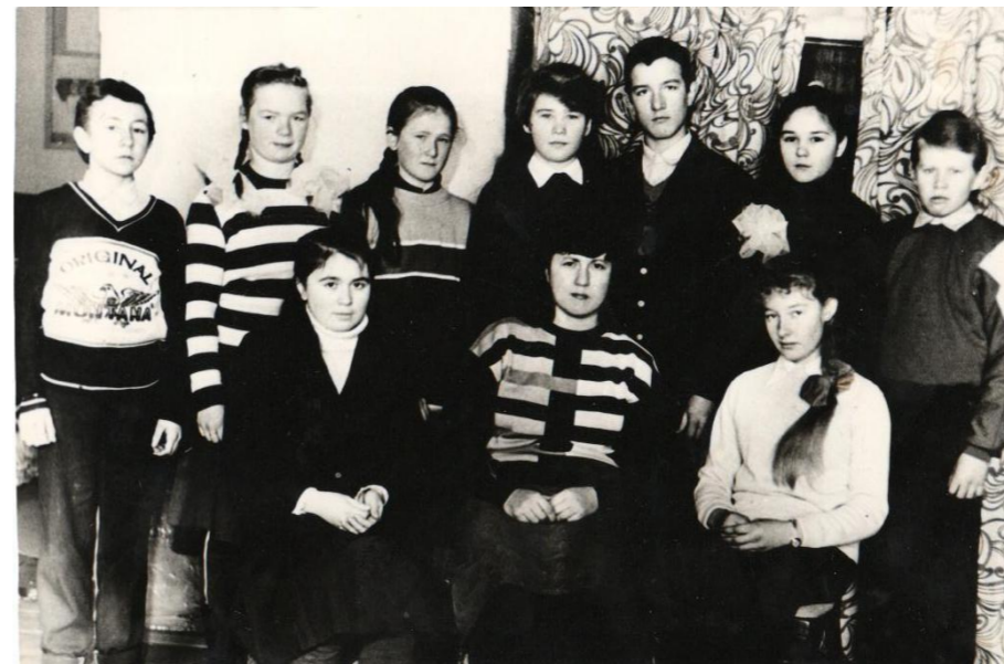
Ризидә апа үзе җитәкләгән сыйныф белән. 1990 нчы ел.

Бала вакытынан ук әниемнең нинди һөнәр иясе икәннен күрәп үстем. Аның дәфтәр тикшергәннәренә кызыгып күзәтә идем. Ул күрмәгәндә мин дә тикшереп куярга тырыша идем. Аннан соң әниемнең бертуганнары физика - математика укытучылары иде. Абыем да математиканы әйбәт белә иде. Күрше малайлары өй эшләрен аңардан сорап керә иделәр. Ул аларга аңлатканны кызыгып тыңлап тора идем.