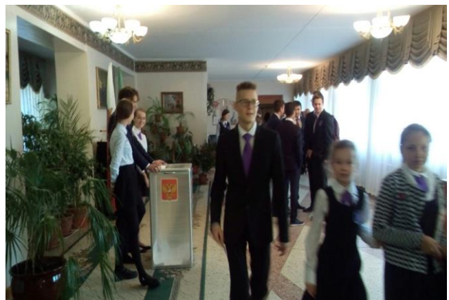
Схема органов ученического самоуправления в лицее представляет собой взаимосвязь всех структур учащихся лицея. Во главе Школьного Совета лицеистов (ШСЛ) находится Совет министров, в который входит Спикер лицея и Главные министры из числа учащихся 5-11 классов. Главные министры ШСЛ возглавляют министерства: