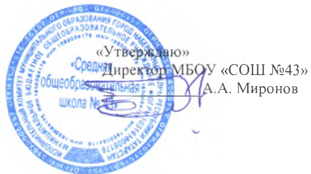
График профилактических мероприятий ( в связи с COVID-19) согласно режима работы столовой МБОУ « СОШ № 43».