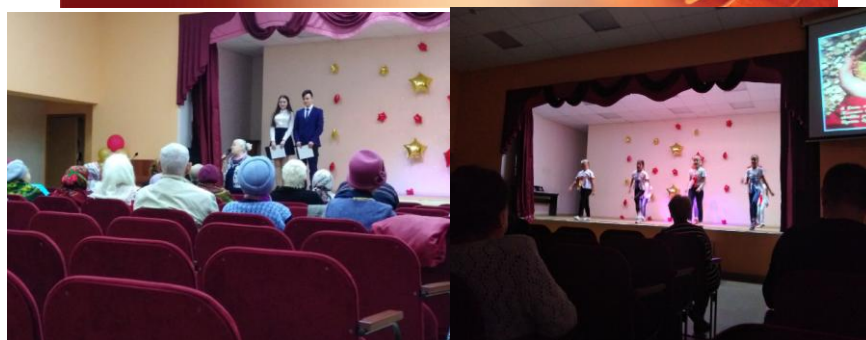
1 октября – Международный день пожилых людей

В России 1 октября отмечается Международный день пожилых людей. В России проходят различные фестивали, организуемые ассоциациями в защиту прав пожилых людей, конференции и конгрессы, посвященные их правам и их роли в обществе. Общественные организации и фонды устраивают в этот день различные благотворительные акции.