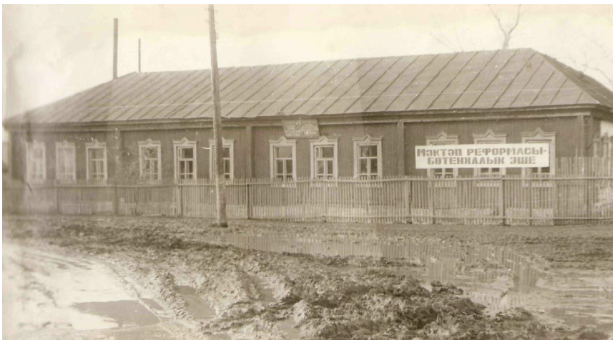
1965 нче елда салынган яңа мәктәп бинасы