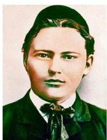
Габдулла Тукай (1886-1913)