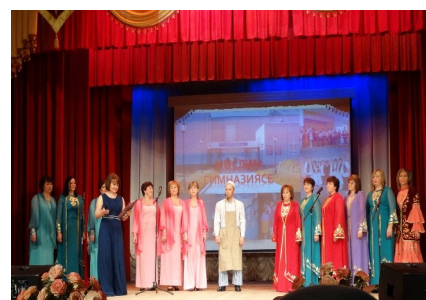
“Серле йөрәк” кызлар вокаль ансамбле