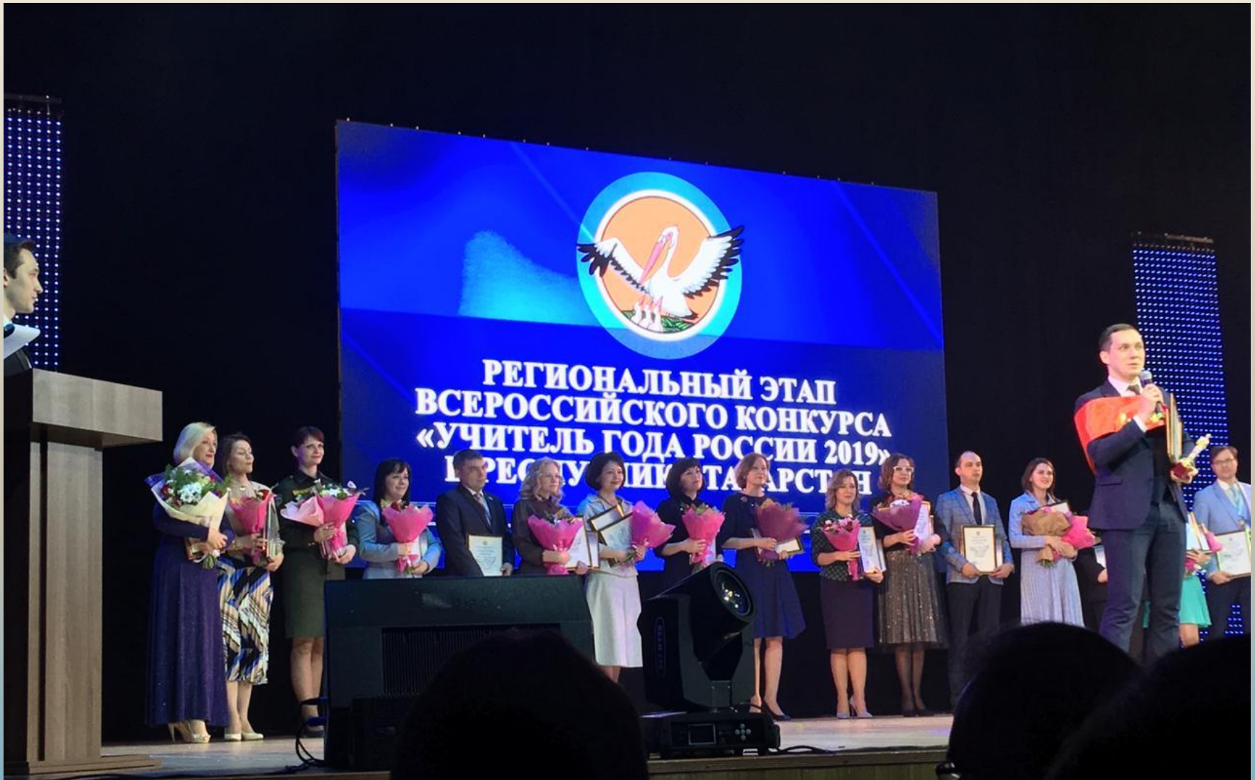
Церемония закрытия и награждение победителей и участников конкурса