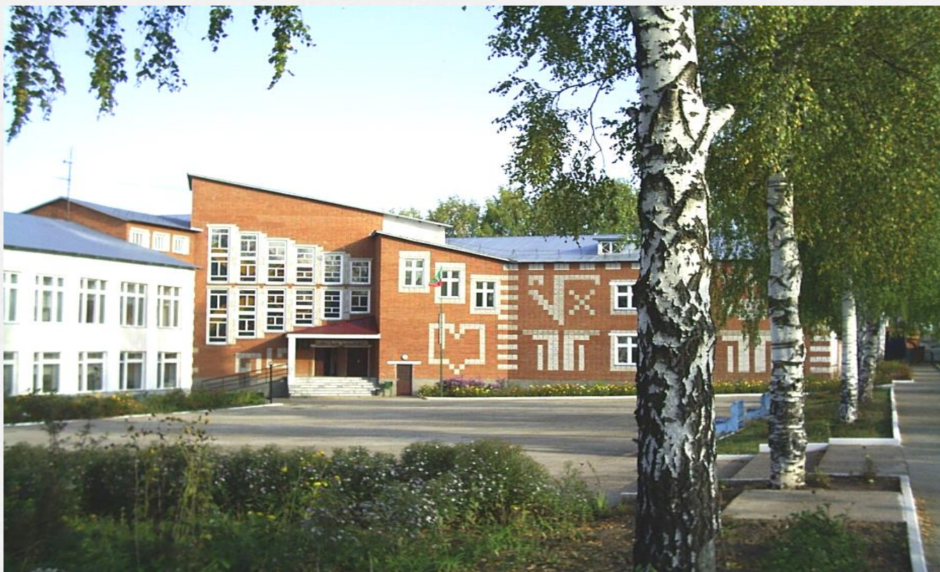
Пристрой школы, сданный в 2002 г.