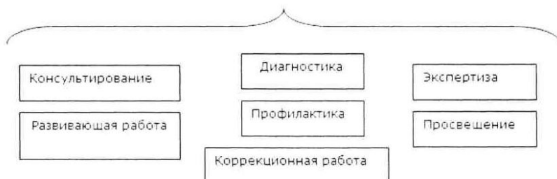
Основные направления психолого-педагогического сопровождения