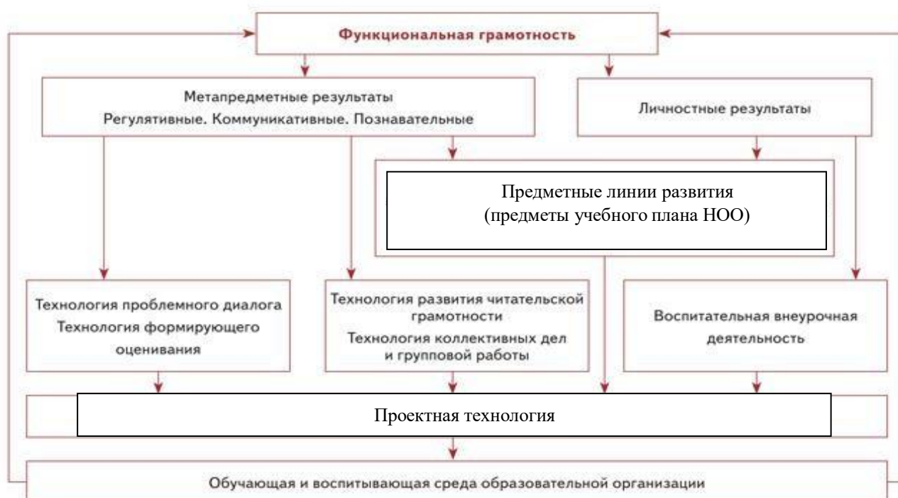
Схема «Система работы по обеспечению личностных и метапредметных результатов школьников»

Реализация цели развития младших школьников как приоритетной для первого этапа школьного образования возможна, если устанавливаются связь и взаимодействие между освоением предметного содержания обучения и достижениями обучающегося в области метапредметных результатов. Это взаимодействие проявляется в следующем: