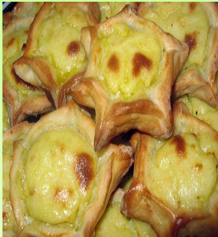
Шаньги с картофелем