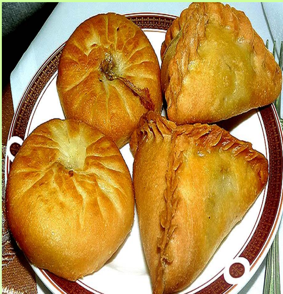
Эч-почмак и бэлэш